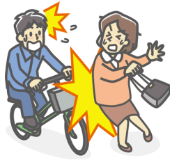
他人にケガを負わせた