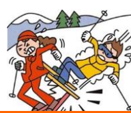
レジャー・旅行中も

熱中症、細菌性食中毒・ ウイルス性食中毒（O-157）による身体の障害が生じた場合も。 天災（地震・噴火またはこれらによる津波）によりケガを負った場合も補償