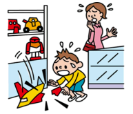
他人の物やお店の物を壊した

日本国内で発生した個人賠償責任補償特約のお支払対象となる事故については、損保ジャパンが示談交渉をお引受けし、事故の解決にあたる「示談交渉サービス」をご利用いただけます。