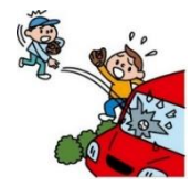
他人の物やお店の物を壊した

日本国内で発生した個人賠償責任補償特約のお支払対象となる事故については、損保ジャパンが示談交渉をお引受けし、事故の解決にあたる「示談交渉サービス」をご利用いただけます。