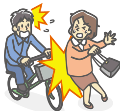
他人にケガを負わせた