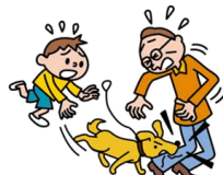
他人にケガを負わせた