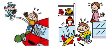
他人の物やお店の物を壊した

日本国内で発生した個人賠償責任補償特約のお支払対象となる事故については、損保ジャパンが示談交渉をお引受けし、事故の解決にあたる「示談交渉サービス」がご利用いただけます。