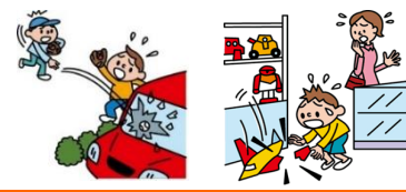
他人の物やお店の物を壊した

日本国内で発生した個人賠償責任補償特約のお支払対象となる事故については、損保ジャパンが示談交渉をお引受けし、事故の解決にあたる「示談交渉サービス」がご利用いただけます。