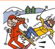
レジャー・旅行中も