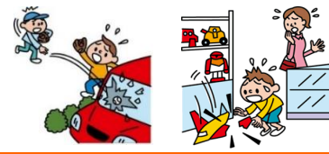
他人の物やお店の物を壊した

日本国内で発生した個人賠償責任補償特約のお支払対象となる事故については、損保ジャパンが示談交渉をお引受けし、事故の解決にあたる「示談交渉サービス」をご利用いただけます。