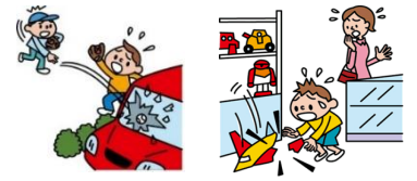
他人の物やお店の物を壊した

日本国内で発生した個人賠償責任補償特約のお支払対象となる事故については、損保ジャパンが示談交渉をお引受けし、事故の解決にあたる「示談交渉サービス」がご利用いただけます。