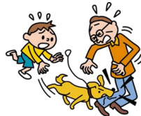
他人にケガを負わせた