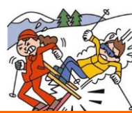
レジャー・旅行中も