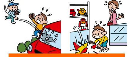
他人やお店の物を壊した

日本国内で発生した個人賠償責任補償特約のお支払対象となる事故については、損保ジャパンが示談交渉をお引受けし、事故の解決にあたる「示談交渉サービス」がご利用いただけます。