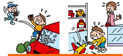
他人やお店の物を壊した

日本国内で発生した個人賠償責任補償特約のお支払対象となる事故については、損保ジャパン日本興亜が示談交渉をお引受けし、事故の解決にあたる「示談交渉サービス」がご利用いただけます。