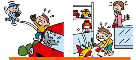
他人やお店の物を壊した

日本国内で発生した個人賠償責任補償特約のお支払対象となる事故については、損保ジャパン日本興亜が示談交渉をお引受けし、事故の解決にあたる「示談交渉サービス」がご利用いただけます。