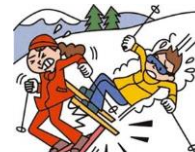
レジャー・旅行中も