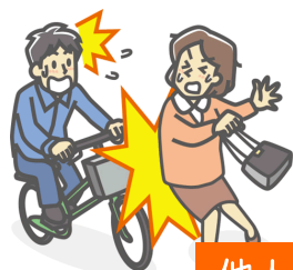
他人にケガを負わせた