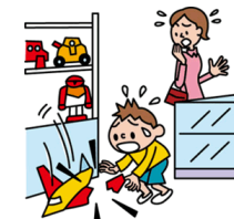
他人やお店の物を壊した

日本国内で発生した個人賠償責任補償特約のお支払対象となる事故については、損保ジャパンが示談交渉をお引受けし、事故の解決にあたる「示談交渉サービス」がご利用いただけます。