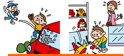
他人やお店の物を壊した

日本国内で発生した個人賠償責任補償特約のお支払対象となる事故については、損保ジャパン日本興亜が示談交渉をお引受けし、事故の解決にあたる「示談交渉サービス」がご利用いただけます。