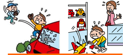
他人やお店の物を壊した

日本国内で発生した個人賠償責任補償特約のお支払対象となる事故については、損保ジャパン日本興亜が示談交渉をお引受けし、事故の解決にあたる「示談交渉サービス」がご利用いただけます。