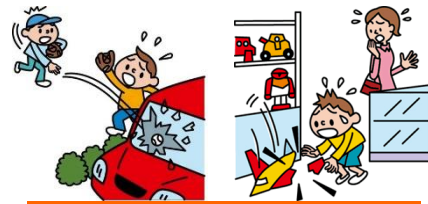
他人やお店の物を壊した

日本国内で発生した個人賠償責任補償特約のお支払対象となる事故については、損保ジャパン日本興亜が示談交渉をお引受けし、事故の解決にあたる「示談交渉サービス」がご利用いただけます。