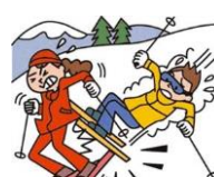
レジャー・旅行中も