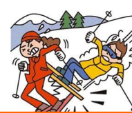
レジャー・旅行中も