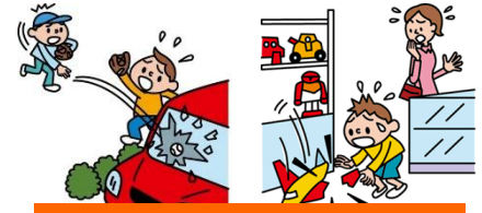
他人やお店の物を壊した

日本国内で発生した個人賠償責任補償特約のお支払対象となる事故については、損保ジャパン日本興亜が示談交渉をお引受けし、事故の解決にあたる「示談交渉サービス」がご利用いただけます。