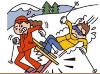
レジャー・旅行中も