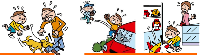
他人やお店の物を壊した

日本国内で発生した個人賠償責任補償特約のお支払対象となる事故については、損保ジャパン日本興亜が示談交渉をお引受けし、事故の解決にあたる「示談交渉サービス」がご利用いただけます。