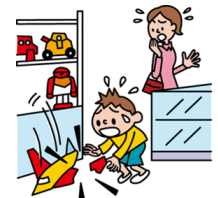
他人やお店の物を壊した

日本国内で発生した個人賠償責任補償特約のお支払対象となる事故については、損保ジャパン日本興亜が示談交渉をお引受けし、事故の解決にあたる「示談交渉サービス」がご利用いただけます。