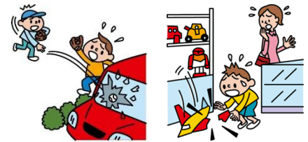
他人やお店の物を壊した

日本国内で発生した個人賠償責任補償特約のお支払対象となる事故については、損保ジャパン日本興亜が示談交渉をお引受けし、事故の解決にあたる「示談交渉サービス」がご利用いただけます。