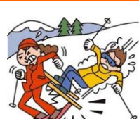
レジャー・旅行中も