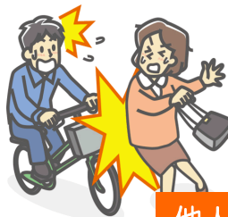
他人にケガを負わせた