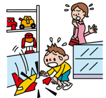
他人やお店の物を壊した

日本国内で発生した個人賠償責任補償特約のお支払対象となる事故については、損保ジャパン日本興亜が示談交渉をお引受けし、事故の解決にあたる「示談交渉サービス」がご利用いただけます。