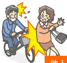
他人にケガを負わせた