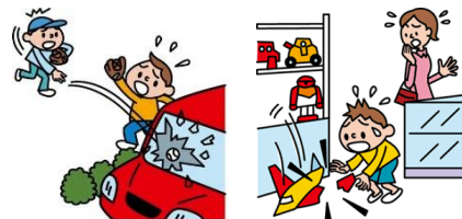
他人やお店の物を壊した

日本国内で発生した個人賠償責任補償特約のお支払対象となる事故については、損保ジャパン日本興亜が示談交渉をお引受けし、事故の解決にあたる「示談交渉サービス」がご利用いただけます。