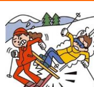
レジャー・旅行中も