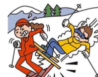
レジャー・旅行中も