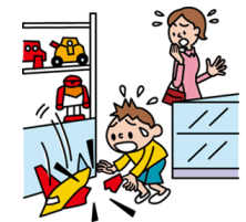
他人やお店の物を壊した

日本国内で発生した個人賠償責任補償特約のお支払対象となる事故については、損保ジャパン日本興亜が示談交渉をお引受けし、事故の解決にあたる「示談交渉サービス」がご利用いただけます。