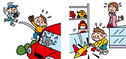
他人やお店の物を壊した

日本国内で発生した個人賠償責任補償特約のお支払対象となる事故については、損保ジャパン日本興亜が示談交渉をお引受けし、事故の解決にあたる「示談交渉サービス」がご利用いただけます。