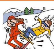
レジャー・旅行中も