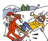
レジャー・旅行中も