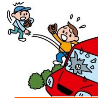
他人やお店の物を壊した