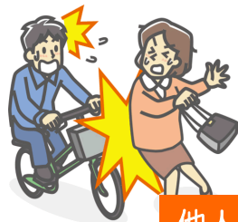
他人にケガを負わせた