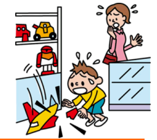
他人やお店の物を壊した

日本国内で発生した個人賠償責任補償特約のお支払対象となる事故については、損保ジャパン日本興亜が示談交渉をお引受けし、事故の解決にあたる「示談交渉サービス」がご利用いただけます。