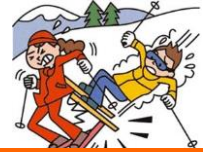
レジャー・旅行中も