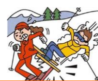
レジャー・旅行中も