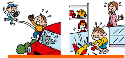
他人やお店の物を壊した

日本国内で発生した個人賠償責任補償特約のお支払対象となる事故については、損保ジャパン日本興亜が示談交渉をお引受けし、事故の解決にあたる「示談交渉サービス」がご利用いただけます。