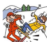
レジャー・旅行中も