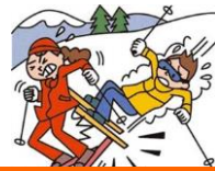
レジャー・旅行中も