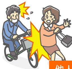
他人にケガを負わせた