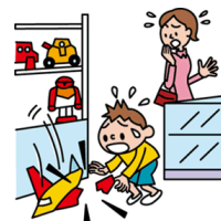
他人やお店の物を壊した

日本国内で発生した個人賠償責任補償特約のお支払対象となる事故については、損保ジャパン日本興亜が示談交渉をお引受けし、事故の解決にあたる「示談交渉サービス」がご利用いただけます。