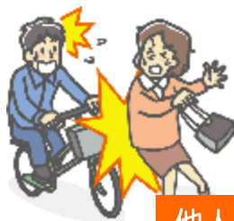
他人にケガを負わせた