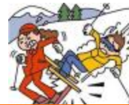
レジャー・旅行中も