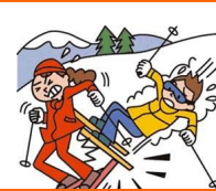
レジャー・旅行中も