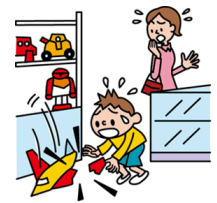
他人やお店の物を壊した

日本国内で発生した個人賠償責任補償特約のお支払対象となる事故については、損保ジャパン日本興亜が示談交渉をお引受けし、事故の解決にあたる「示談交渉サービス」がご利用いただけます。