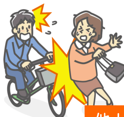
他人にケガを負わせた