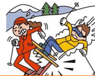
レジャー・旅行中も