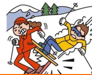
レジャー・旅行中も